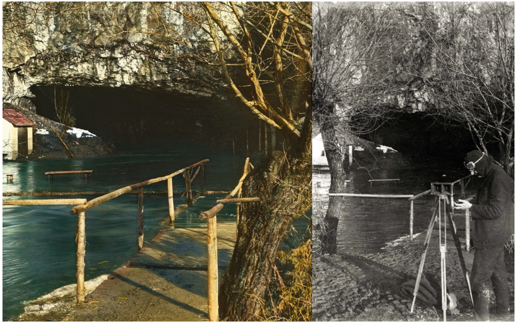
Obr. 5: Karel Absolon fotografuje povodeň: Vlevo kolorovaný diazitiv povodně ve vchodu do Sloupských jeskyní, vpravo fotograf Karel Absolon pořizující snímek povodně.

V depozitáři Moravského zemského muzea jsou uloženy tisíce fotografií a skleněných diazitivů, mnohdy ručně kolorovaných, které již byly dříve digitalizovány. Je to materiál, který zůstal v muzeu po Absolonově odchodu do penze. Mnoho fotografií měl však Absolon ve své soukromé pracovně doma a ty jsou nyní uloženy v památníku. Řada z nich je známa a byla opakovaně publikována. Přesto se tu nacházejí další desítky záběrů dosud neznámých. Jedná