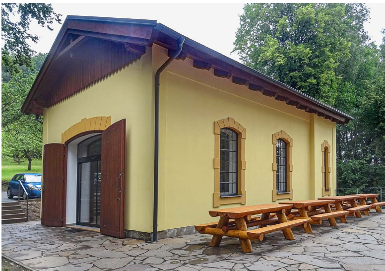
Nadzemní část je téměř dokonalou kopií původní výtopny lokomotiv.