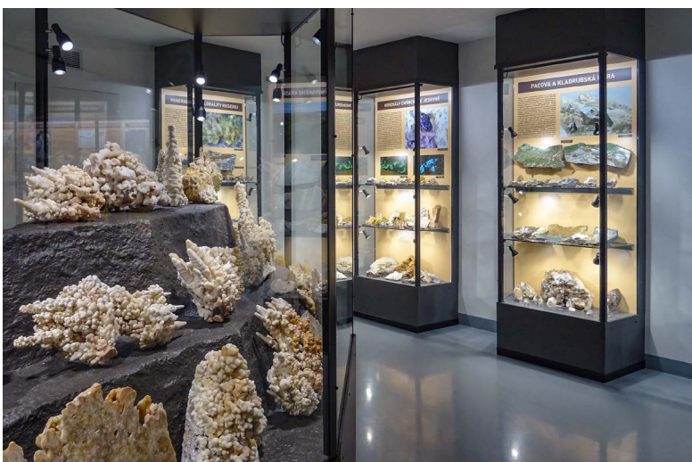
Součástí návštěvnického střediska je i geologická a mineralogická expozice.