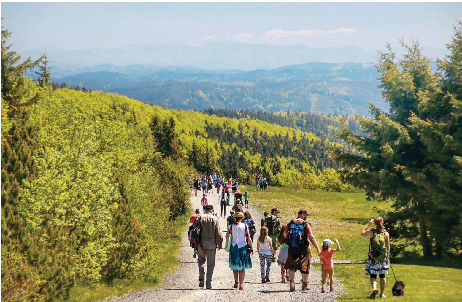
Radhošťský hřeben je oblíben turisty.