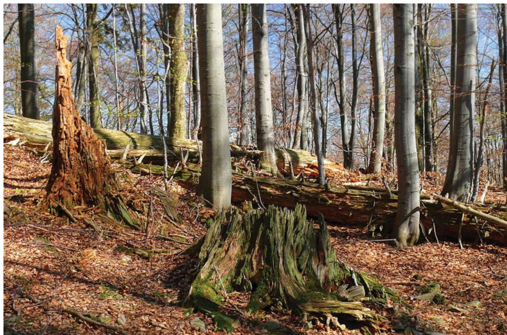
Zbytky jedlobukového porostu v NPR Mionší.

Když byly po vstupu do Evropské unie Beskydy zařazeny mezi evropsky významné lokality, bylo najednou patrné, že to, co považujeme za běžné a normální, jako jsou naše bukové lesy plné jar-