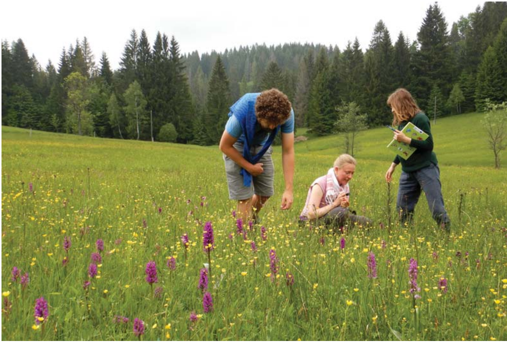
Monitoring chráněných druhů.

ních bylin nebo rozkvetlé ovsíkové louky, že to už v Evropě vůbec běžné není a že je potřeba chránit i taková stanoviště před velkoplošnými intenzivními způsoby hospodaření. Že moderní velké traktory se sekačkami nebo lesní harvestory s vyvážecími soupravami nám sice usnadní práci a zvednou zisky, na druhé straně po nich zůstane chudá krajina tvořená několika odolnými druhy. Žádná různorodost, žádná krása pro oči, žádné potěšení pro duši.