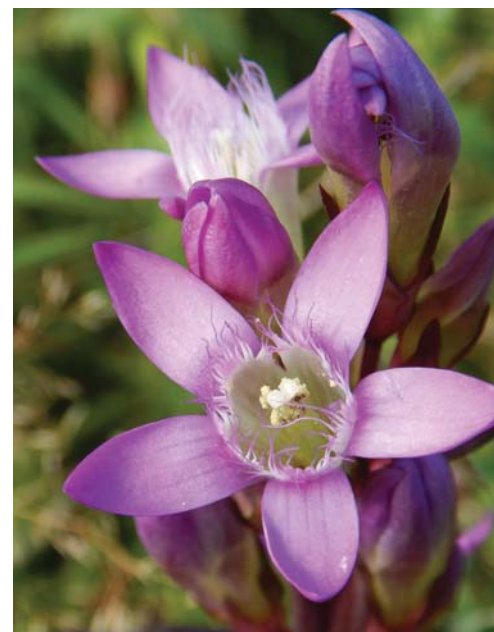
Hořeček žltavý karpatský patří k našim nejohroženějším rostlinám.

poškozeno působením průmyslových exhalací. To vedlo k přehodnocení ochranných podmínek maloplošných chráněných území, která nyní měla sloužit pro sledování regeneračních procesů.