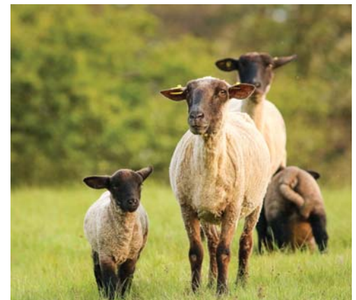
Pro zachování charakteru krajiny a řady biotopů je extenzivní pastva ovcí naprosto zásadní.

Dlouhodobě je v Beskydech řešena problematika ochrany velkých šelem a jejich monitoring a od roku 2000 také náhrady škod. Společně s vlastníky, hospodáři a nevládními ochrannými organizacemi se realizovala řada projektů. Za zmínku určitě stojí projekt návratu orla skalního nebo opatření na podporu tetřeva hlušce, jejichž součástí je také vybudování odchovny tetřevů a jejich následné vypouštění. Z evropských dotací byly podpořeny projekty na ochranu motýlů (LIFE for insect) nebo podporu lužních stanovišť v povodí Morávky. Mnoho úsilí bylo věnováno ochraně vodní fauny při vodohospodářských úpravách (například projekt Ryba a bagry) a také zadržování vody v krajině (od tvorby tůní pro obojživelníky až po podporu zasakování dešťové vody v lesích odstraňováním nepoužívaných lesních linek). V roce 2013 byla na části CHKO vyhlášena Beskydská oblast tmavé oblohy. Jedná se o druhý mezinárodní park tmavé oblohy na světě. Přibližně dvě třetiny oblasti leží na českém území a třetina na slovenském