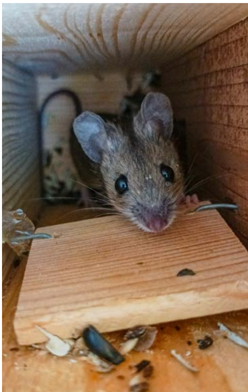
Obr. 6: Myšice odchycená na ekoduktu Planá nad Lužnicí (D3).