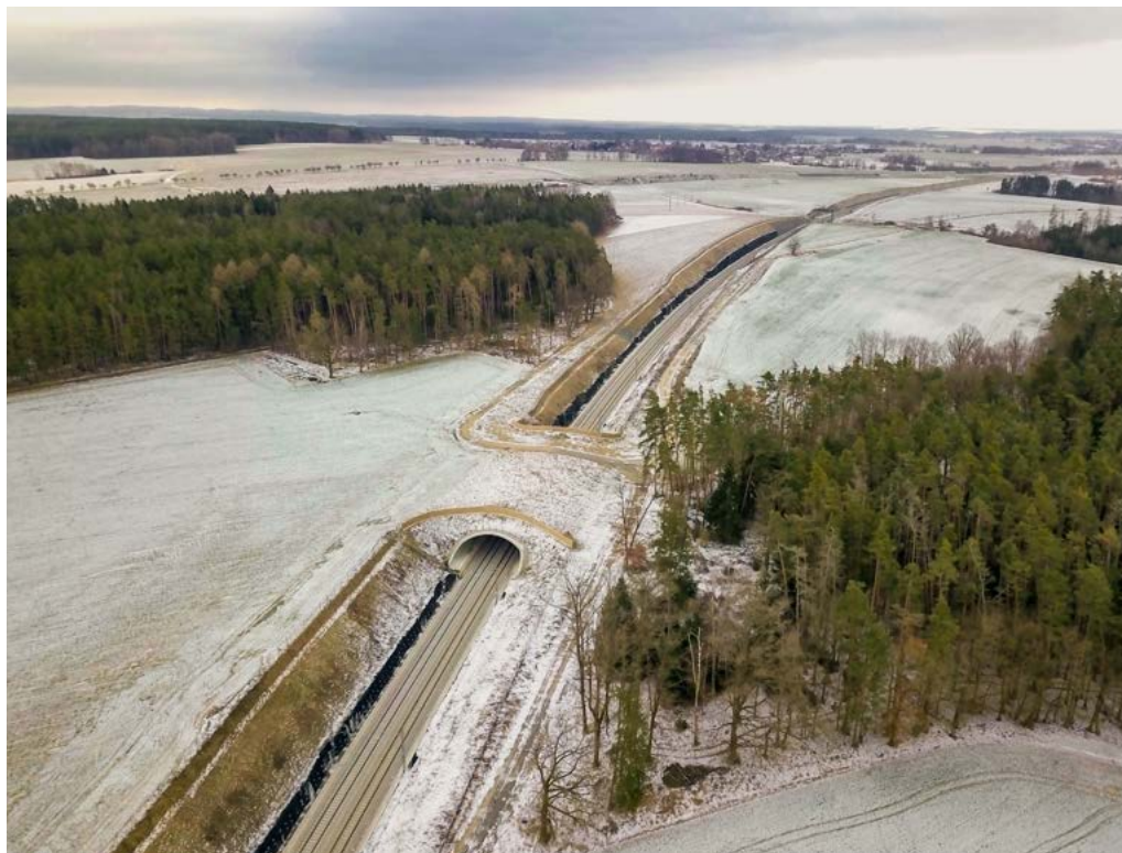
Obr. 7: První ekodukt na železnici u obce Doubí v jižních Čechách.

o ekoduktech, databáze však bude připravena na budoucí doplnění i jiných typů průchodů, jako jsou podchody, a to jak stávající, tak i plánované. Na dynamické mapě je zřejmá poloha objektu a po „kliknutí“ na bod ekoduktu se objeví kontextové okno se základními informacemi, jako je např. rok uvedení do provozu, účel stavby, šířka, délka apod. Nedílnou součástí je expertní hodnocení funkčnosti ekoduktu, pro každou kategorii živočichů A–G (dle TP180). Na konci kontextového okna daného ekoduktu je také odkaz na pdf, ve kterém jsou další informace s hodnocením účinnosti pro danou kategorii živočichů a výčtem zjištěných druhů během fotomonitoringu. Mimo tyto základní informace viditelné pouze na mapovém rozhraní je k dispozici ke stažení kompletní databáze ve formě GIS vrstvy s dalšími detailnějšími informacemi, např. o protihlukové stěně, typu migračního prostoru, vegetačních úpravách, oplocení nebo přítomnosti komunikace na objektu.