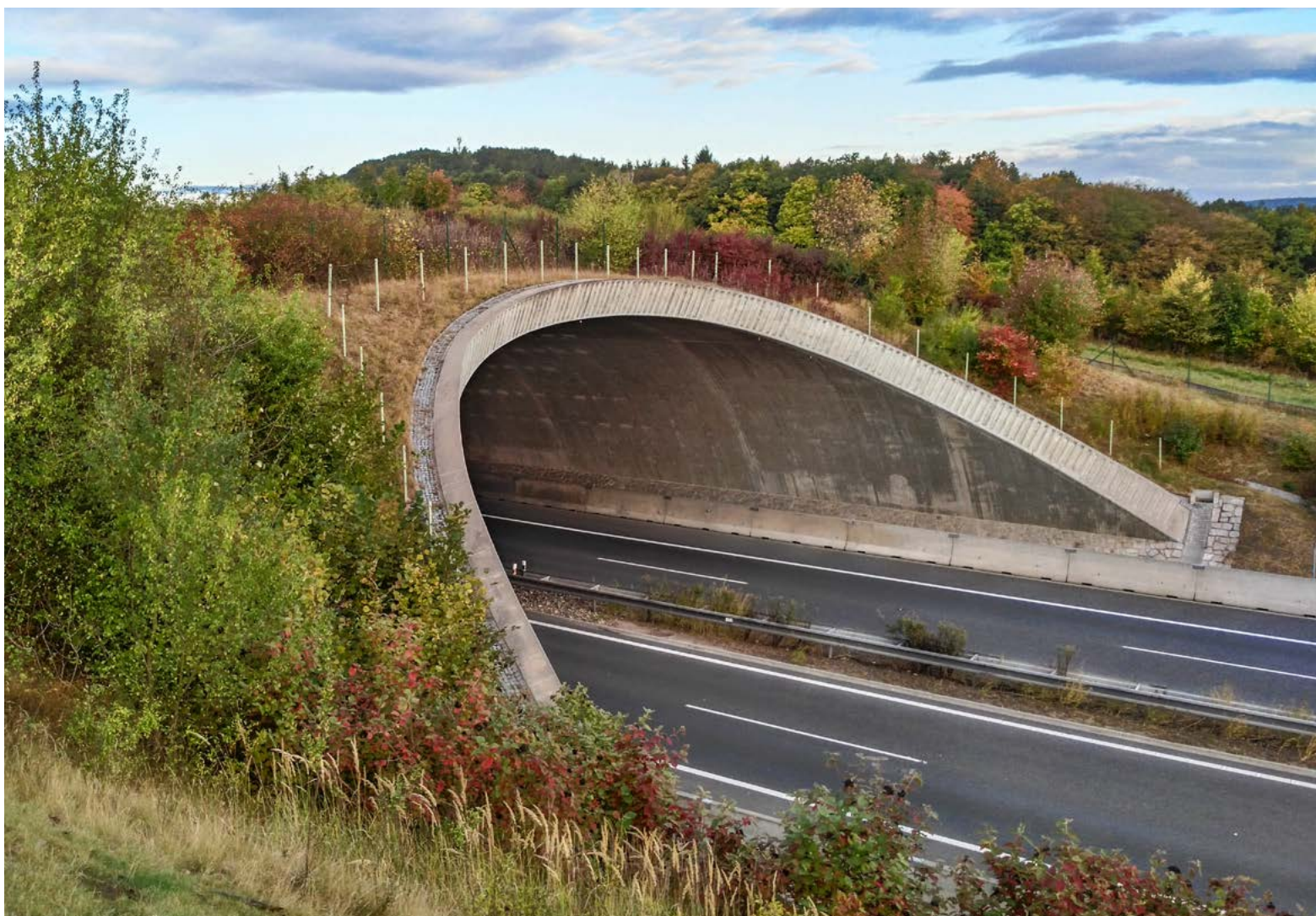
Obr. 1: Ekodukt na dálnici D11 v lokalitě Žehuň.