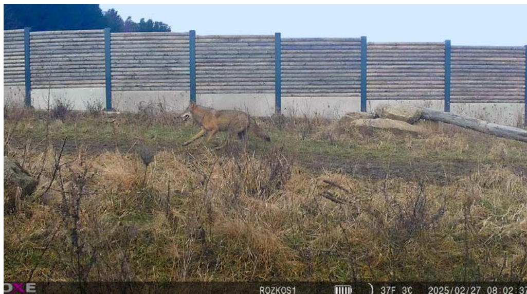
Obr. 2: Vlk obecný na ekoduktu Bílý Kostel nad Nisou (Rozkoš – I/13).

Početnost zjištěných druhů odpovídá jejich běžné populační hustotě, nárokům na kvalitu prostředí i na parametry ekoduktů. Nejčastěji byli zaznamenáni živočichové kategorie B (dle Technických podmínek 180 Ministerstva dopravy, dále TP180): srnec (44 %), daněk (14 %), zajíc (14 %) a prase divoké (13 %). Mezi nejvýznamnější