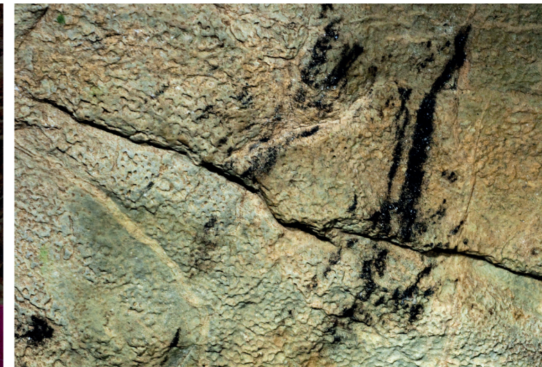
Kresebné stopy v Hlavním dómu staré cca 2 600 let.

je překvapivá, protože dosud se nepodařilo v Moravském krasu nalézt kresbu či kresebnou stopu z tohoto období. Druhý vzorek byl datován do období před cca 7000–7200 lety. Shodou okolností se jedná o nepravidelné skupiny uhlíkových čar na výrazném skalním výčnělku, ze kterých již byly dvakrát odebrány vzorky uhlíku pro analýzu, ale množství nebylo dostatečné. Překvapivý výsledek tak podpořil skutečnost, že lidé v pozdním neolitu navštěvovali různá místa staré části Kateřinské jeskyně opakovaně a zanechávali v jejích prostorách stopy. Poslední datovaná kreseb-