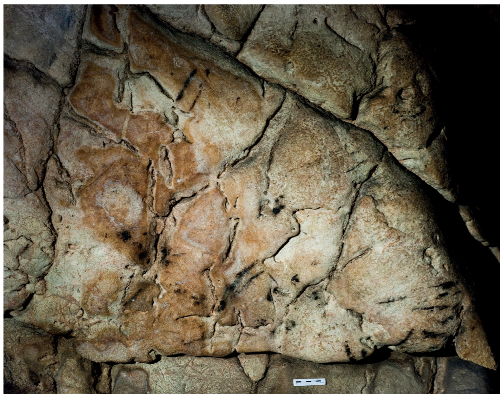
Skalní výčnělek v severovýchodní části Hlavního dómu s kresebnými stopami starými cca 7 000 let.

Po nálezu dalších zajímavých objektů, skupin čar a abstraktních obrazců z nich byly některé vytipovány pro pokračující studium a odběr vzorku uhlíku k datování. Na této etapě výzkumu se podílel opět tým odborných pracovníků ze SJČR, UP Olomouc a ÚJF AVČR Praha. Odběr však probíhal za účasti dalších expertů, našich a slovenských archeologů dne 29. 8. 2019. Osvědčenou citlivou metodikou bylo odebráno celkem šest vzorků. Tři z Ledové chodby; nacházejí se v blízkosti pravěkých objektů datovaných z předchozí série vzorků, dále dva ze stěn v Hlavním dómu a jeden v bezejmenné chodbě, taktéž v blízkosti dříve datované pravěké kresebné stopy. Zpracování odebraného materiálu provádělo opět specializované pracoviště ÚJF