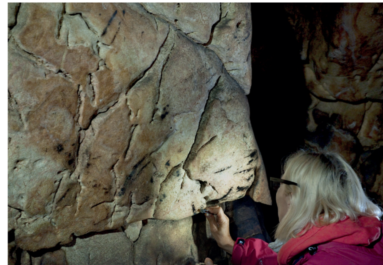
Odběr vzorku uhlíku z kresebných stop pro analýzu.

ných objektů neměly dostatečné množství uhlíku k exaktní analýze. Podařilo se datovat pouze dva vzorky, oba odebrané z kresebných stop v severovýchodní části Hlavního dómu. První z nich svým stářím (cca 2500–2800 let) zapadá do období halštatu. I tato skutečnost