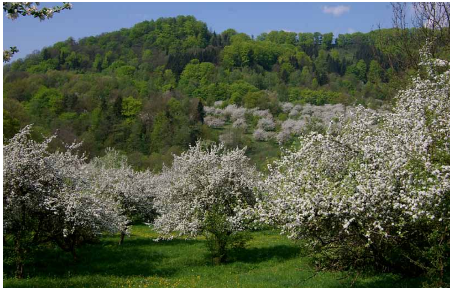
Skupinové výsadby ovocných stromů jsou výraznou součástí krajinného rázu České republiky již po několik staletí.

Závěrem bych chtěl poděkovat za laskavou podporu projektu Oživení starých odrůd. Tento projekt č. 76-FN-028, financovaný v rámci priority 4 „Ochrana životního prostředí a klimatické změny“ z prostředků Finančního mechanismu EHP 2009–2014 v rámci programu CZ03 – Fond pro nestátní neziskové organizace poskytovatelem grantu Nadací Partnerství, umožnil dokončení prací na druhém vydání záchranných sortimentů. Zároveň je z tohoto grantu financována tvorba podpůrných nástrojů – výběrové databáze ovocných odrůd a národní databáze genofondových ploch.