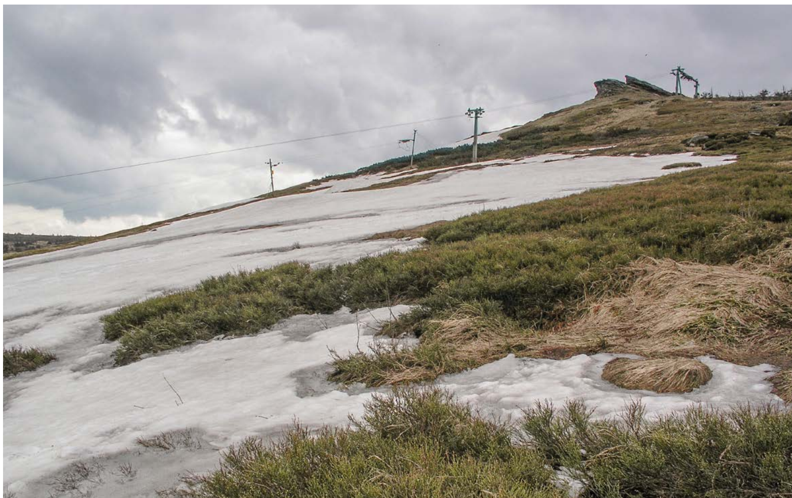
Obr. 1: Díky své přizpůsobivosti v růstu a v časových posunech vývojových fází dokáže borůvka docela dobře prosperovat na ploše sjezdové trati v nejvyšších polohách našich hor (NPR Praděd).

patří možná překvapivě všem dobře známá brusnice borůvka ( Vaccinium myrtillus ). Její šíření, které je dáváno do souvislosti s ukončením tradičního managementu, atmosférickou depozicí dusíku a oteplováním, přesáhlo místy únosnou mez i v nejvyšších polohách našich hor.