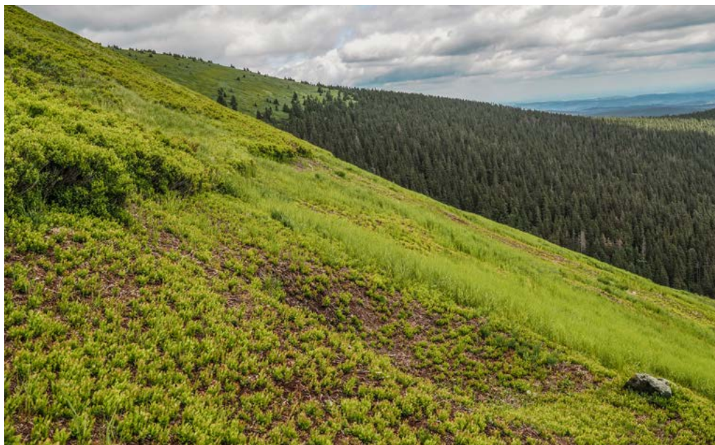
Obr. 4: Již z výšky borůvkového porostu lze poznat, kde probíhá management. Díky několikaletému každoročnímu sečení lze dosáhnout výrazné redukce nadzemní biomasy borůvky a podpory ostatních růstových forem.