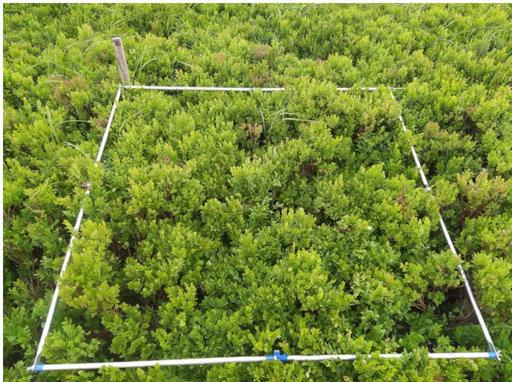
Obr. 2: Expanze borůvky nesouvisí jen s jejím plošným šířením, ale i se zahušťováním vlastních porostů. Svým růstem a ovlivněním podmínek prostředí je pak borůvka schopná vytěsnit většinu ostatních druhů. Důsledkem jsou rozsáhlé a druhově uniformní plochy pouze s borůvkou.

Borůvka je proto právem považována za velmi plastický druh, který se svými fyziologickými