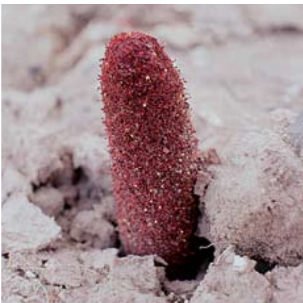
Hnědočervená květenství patří rostlině Cynomorium coccineum , která coby parazit čerpá všechnu výživu z kořenů pouštních dřevin.

V roce 1999 bylo Wadí Rum známou mezinárodní organizací na ochranu ptáků a jejich prostředí BirdLife International zapsáno na seznam významných ptačích území (IBA) Středního východu: především jako důležitá zastávka na jarních a podzimních tazích ptáků, zejména dravců. Roku 2000 tu napočítali v průběhu necelého měsíce 3 381 jedinců