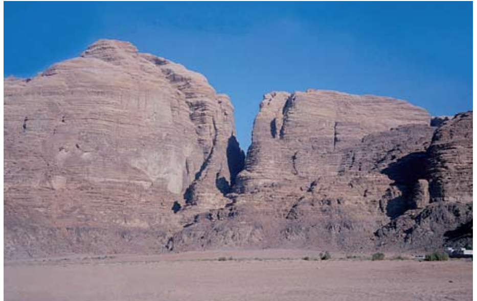
Do širokých vádí ústí z boku těsné skalní kaňony. Souvrství hnědočervených slepenců a pískovců překrývají starší černošedé vyvřeliny – granitoidy.

Wadi Rum se rozkládá na severozápadním okraji Arabské pouště v jižním Jordánsku při hranici se Saúdskou Arábií. Geografická poloha je zhruba dána souřadnicemi 29° s. z. š. a 35° v.z.d. Ve skutečnosti to není jediné údolí, ale celý systém širokých vádí a úzkých kaňonů mezi strmými skalnatými plošinami a vrchy s druhou nejvyšší horou Jordánska Džebel Rum (1 754 m n. m.); dna údolí leží 800–1 000 m n. m. Ráz severní