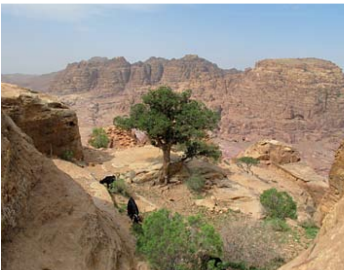
Horní plošiny ve Wadi Rum, v popředí s jalovcem fénickým (Juniperus phoenicea) a kozami místních beduinů

(kambria a ordoviku). Souvrství o mocnosti několika set metrů (nechybí v nich ani pěkný skalní most) překrývají podloží proterozoických hlubinných vyvřelin – granitoidů, tedy žul odlišného zbarvení. Dna údolí vyplňují mladá aluvia.