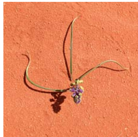
Na snímku je jarní geofyt (rostlina přežívající ve ztlustlých podzemních orgánech) – blíže neurčený druh modřence ( Muscari sp.) z čeledi hyacintovitých.