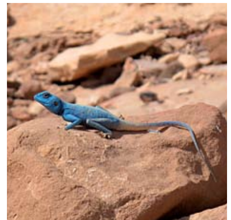
Nádherným zjevem jsou ve Wadí Rum modře zbarvení samci agamky sinajské ( Pseudotrapus sinaitus ) dorůstající délky až 40 cm.