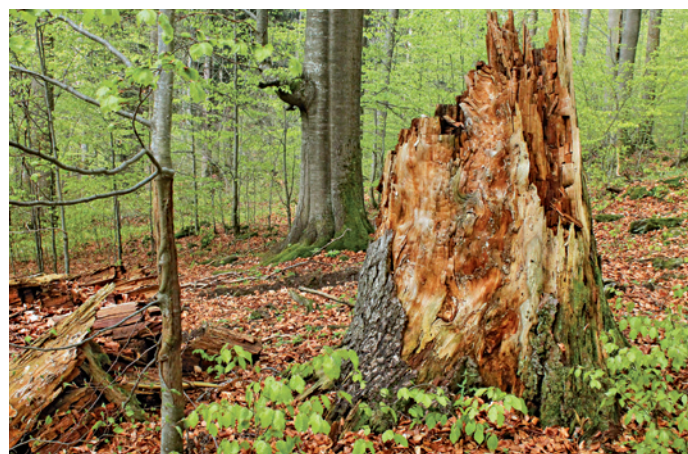
Boubínský prales je největší nedotčenou plochou původního lesa ve střední Evropě.

ně 20. století: původní nedotčený fragment byl v roce 1958 znovu vyhlášen jako jádrová zóna a bylo k němu přidáno rozlehlé ochranné pásmo (666 ha). V něm měly být přednostně uchráněny zbytky pralesovitých porostů před těžbou. V roce 1992 bylo ochranné pásmo vyhlášeno národní přírodní rezervací, od roku 2006 přibýlo k jádrové zóně dalších cca 50 ha lesů, mezi nimi i část horské smrčiny na severovýchodním svahu Boubína, kde nejstarší stromy dosahují věku kolem 300 let.