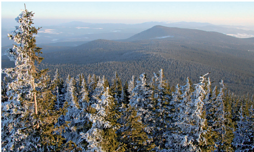
Oblý masív Boubína (1 362 m n. m.) tvoří spolu s vrcholem Bobík (1 264 m n. m.) charakteristickou siluetu Šumavy.

Ještě za Johnova života, v říjnu 1870, postihla revír Zátoň silná vichřice, která vyrátila i část původního pralesa. A rezervace málem vzala za své. Při odstraňování polomů a stromů následně napadených lýkožroutem smrkovým byla téměř vytěžena a jen 47 ha na pravém břehu Kaplického potoka bylo ponecháno jako nedotčený fragment. Snahy o záchranu zbytků pralesa přišly až v polovi-