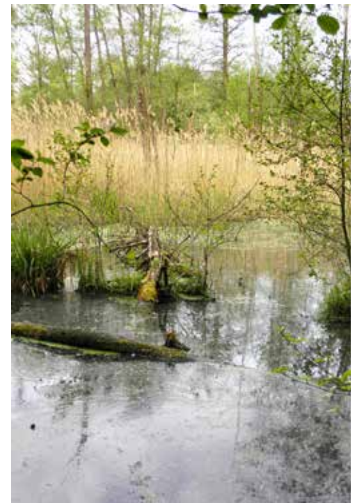
Tůň Staré Labe.