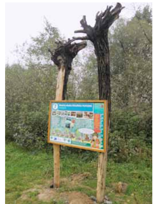
Jedno ze zastavení naučné stezky.