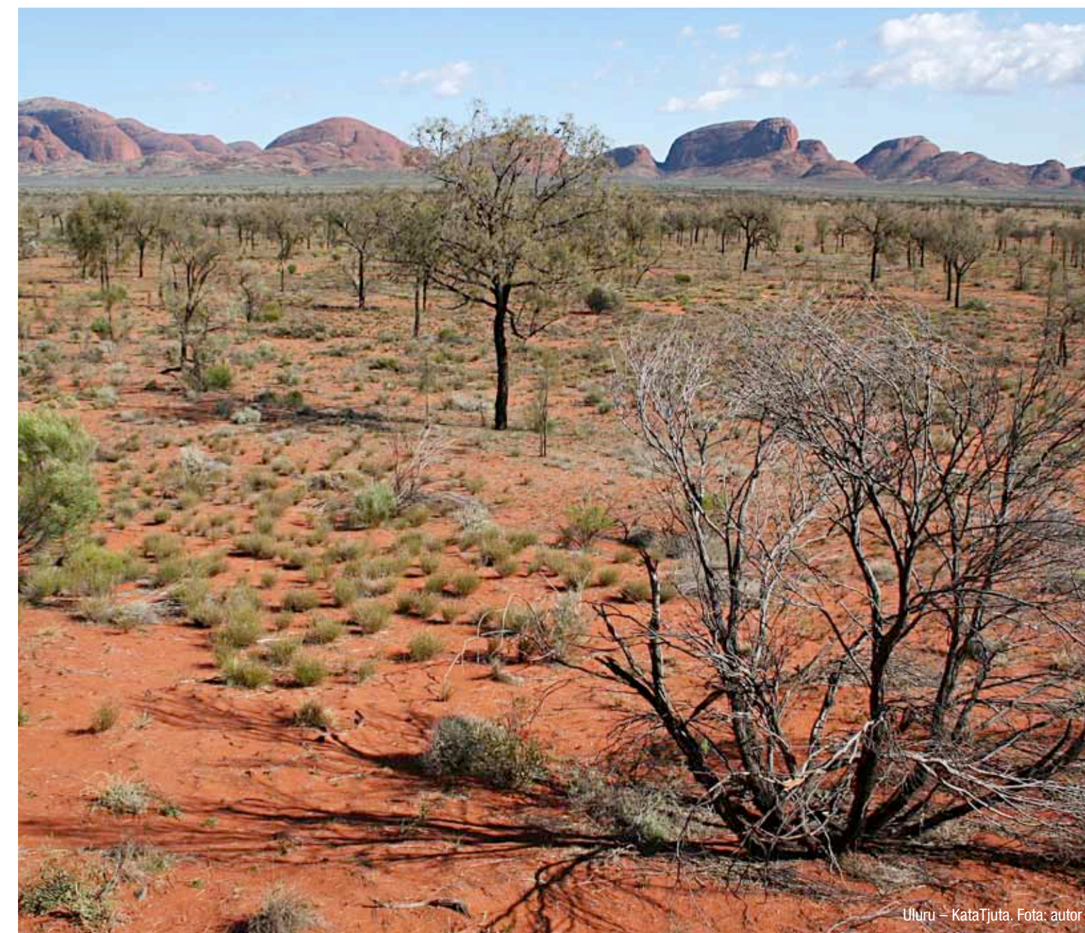
Uluru – KataTjuta.

vyprahlé savany, polopouště a pouště, kterým dominuje neskutečný monolit Uluru spolu s dalšími podobně bizarními červenými skalními masivy.