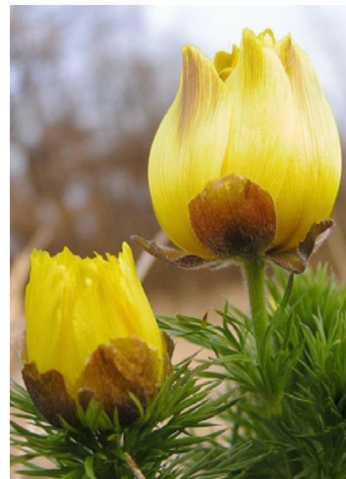
Hlaváček jarní v soukromé rezervaci Zázmoniky u Bořetic (navazuje na stejnojmennou přírodní rezervaci), kterou postupně vykupuje ze sbírky Místo pro přírodu spolek Sdružení pro venkov.

Zřídili jste soukromou rezervaci a v tomto příspěvku není o Vás zmínka, ani není Vaše lokalita vyznačena na mapě soukromých rezervací? Napište nám o svém projektu do redakce.