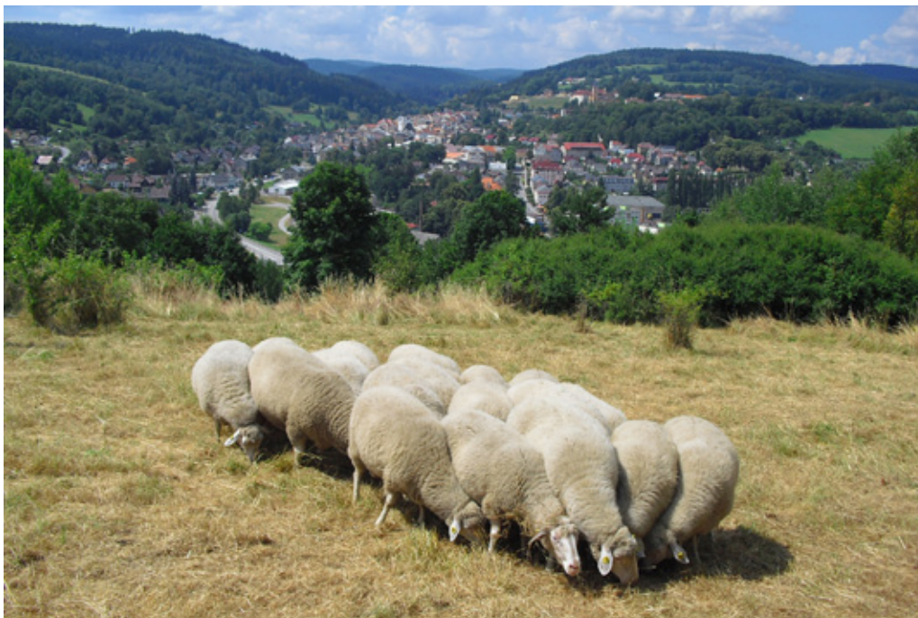
Pastva ovcí na Velké homolce, soukromé přírodní rezervaci u Vimperka. Entomologicky cenná pastvina byla částečně vykoupena Českým svazem ochránců přírody v r. 2014.