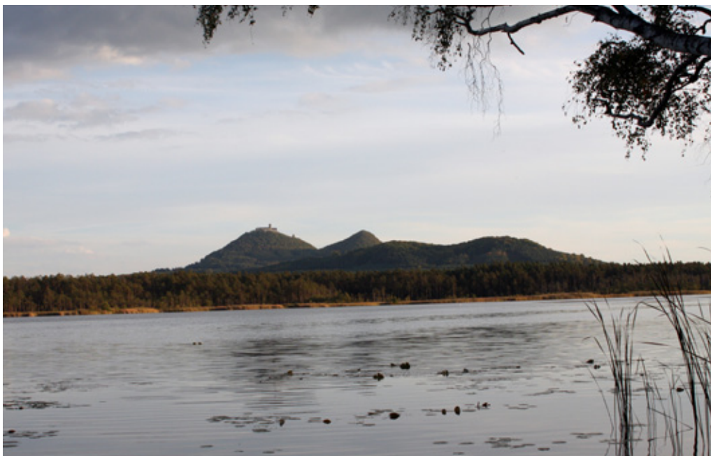
Mezi první soukromé snahy o ochranu přírody patří vyloučení lesů na Velkém a Malém Bezděžu z běžného hospodaření již v r. 1833.