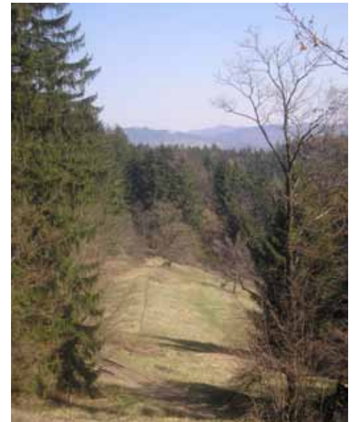
Přírodní památka Dobšena s výhledem na slovenské hory.

Východištěm dnešní vycházky bude železniční zastávka Valašské Příkazy. Na nejsevernější bělokarpatský hřeben vylezeme po zelené turistické značce přes ves Študlov. Na rozcestí Požár se již ocitáme na hřebeni, v nadmořské výšce něco málo přes 750 m. Po něm se vydáme stále po zelené značce k západu. Stoupáme lesem s menšími horskými loukami pod vrchol Kyjanice (770 m n. m.), kde vstupujeme na území CHKO Bílé Karpaty.