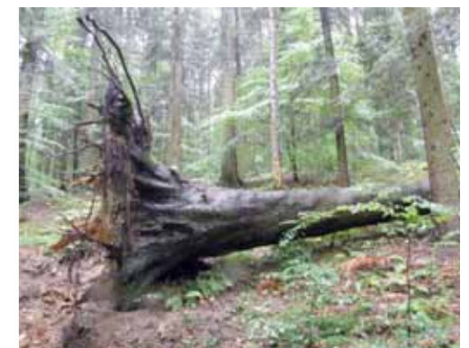
Na Ščůrnici dostává příroda volnost.