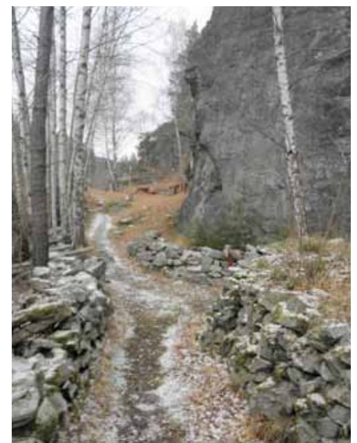
Stezka při úpatí Opolence.