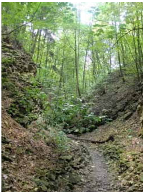
Soutěska se starohorními břidlicemi.