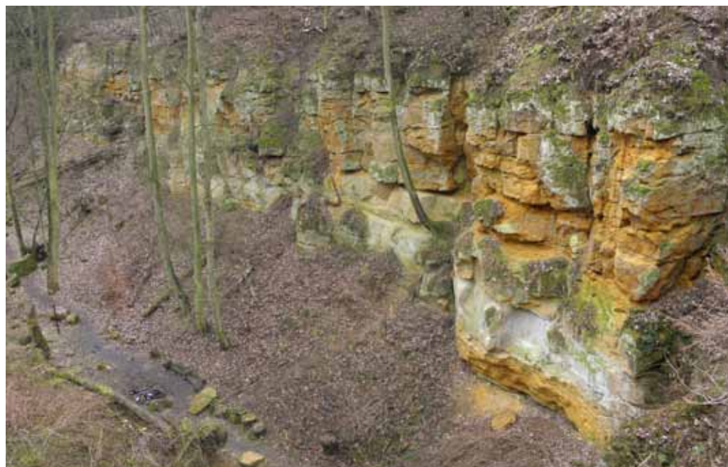
Pískovcové skály v rokli Housle.